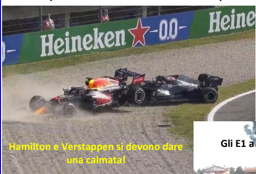
Hamilton e Verstappen si devono dare una calmata!