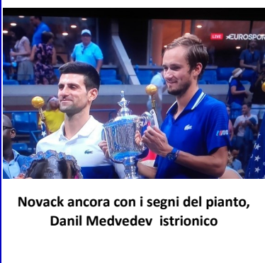
Novack ancora con i segni del pianto, Danil Medvedev istrionico