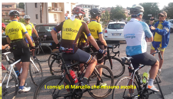
I consigli di Marcello che nessuno ascolta